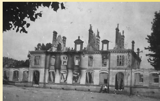
Les écoles de Chabonais